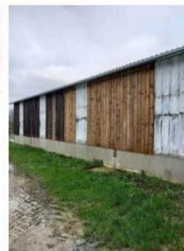
Lait de chaux sur transluclide.

L'audit n'est pas un contrôle, mais un outil de progrès. Il repose sur l'échange entre l'éleveur et le technicien.