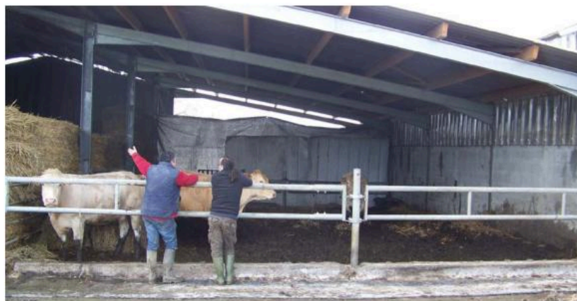
Le GDS propose des audits techniques pour identifier les éventuelles faiblesses techniques des bâtiments et apporter des solutions adaptées, concrètes et économiquement réalistes.